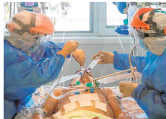
Dos enfermeras atienden a un paciente en una UCI

García defiende que si no se confina, los datos podrán ser peores que en la primera ola: «Si no confinamos pronto serán iguales o peores». En cuanto al perfil de ingresados, siguen siendo pacientes de 45 a 70 años. «El porcentaje de hombres y mujeres es similar y también vemos jóvenes de 30 sin ninguna patología previa», advierte Martín. Según Sanidad, el porcentaje total de pacientes en camas de UCI es del 27,76% a nivel nacional, con Comunidad Valenciana a la cabeza con un 45,05%; Cataluña con 41,68%; La Rioja con 40%; Baleares con 39,41% o Madrid con 36,06%.